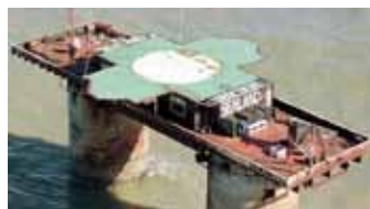
La Principauté du Sealand, au large des côtes britanniques, a célébré ses 50 ans en 2017.